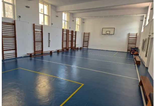
Terenul de sport