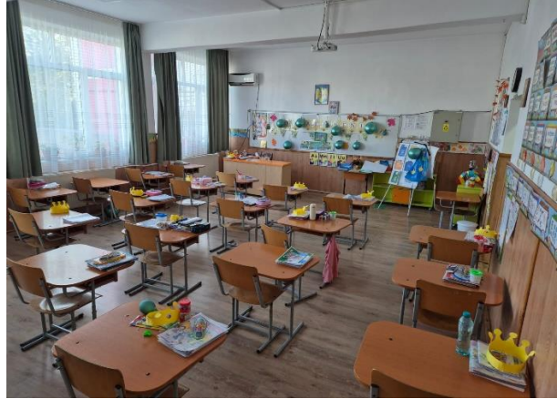
Sală de clasă primar/gimnaziu